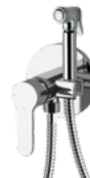
WE 65 LT8 Miscelatore incasso per shut-off comprensivo di: doccetta shut-off art. 332OL, supporto doccia-presa acqua su piastra in ottone cromato e flessibile doccia cm 120. Built-in shower mixer set including :shut-off art. 332OL, shower holder-water punch on flange, all in c.p. brass and shower flexible cm 120.