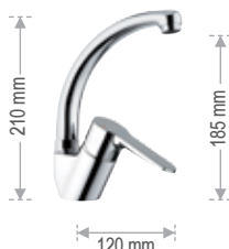
WE 42 C LT8

Miscelatore monocomando per lavello, bocca alta, modello corto, tipo lusso. Single-lever one-hole sink mixer, high spout, shorter model, luxury type.