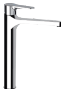
WE 11L LT8 Miscelatore monocomando lavabo. Single-lever basin mixer.