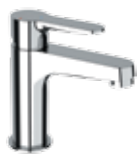
WE 11 LT8 Miscelatore monocomando lavabo. Single-lever basin mixer.