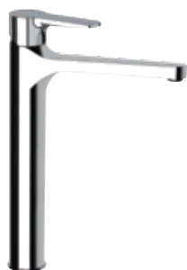
WE 10L LT8 Miscelatore monocomando lavabo. Single-lever basin mixer.