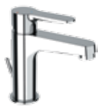
WE 10 LT8 Miscelatore monocomando lavabo. Single-lever basin mixer.