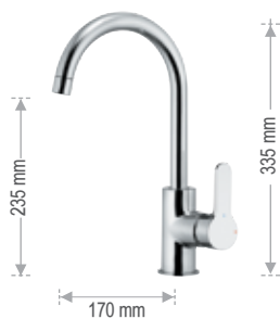
WE 72 LT8

Miscelatore monocomando monoforo 90°, con canna alta a "U". Single-lever sink mixer 90°, high "U" spout.