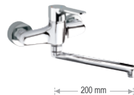
WE 41 LT8

Miscelatore monocomando per lavello a muro. Single-lever wall mounted sink mixer.