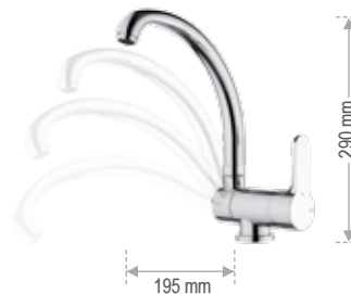
WE 42 R LT8

Miscelatore monocomando monoforo 90° per lavello, con bocca alta, tipo lusso, modello sottofinestra. Single-lever one-hole sink mixer, with high spout, luxury type, under window type.