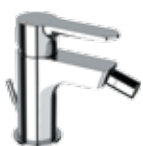
WE 20 LT8 Miscelatore monocomando bidet. Single-lever bidet mixer.