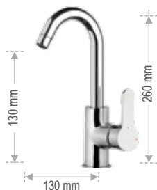
WE 72 C LT8

Miscelatore monocomando per lavello, con canna corta a "U", tipo lusso. Single-lever one-hole sink mixer, with short "U" spout, luxury type.