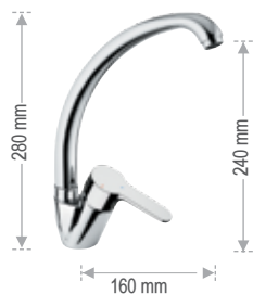
WE 42 LT8

Miscelatore monocomando per lavello, con bocca alta. Single-lever one-hole sink mixer, with high spout.