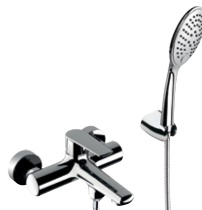
V 02 Miscelatore vasca esterno con kit doccia, flessibile 150 cm. Exposed bath mixer with shower kit, flexible 150 cm.