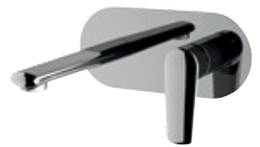
V 15 Miscelatore monocomando a incasso per lavabo, con piastra rettangolare in ottone cromato. Single-lever built-in basin mixer, with rectangular wall flange in chrome plated brass.