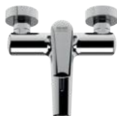
V 05 Miscelatore vasca esterno senza kit doccia. Exposed bath mixer without shower kit