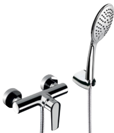
V 38 Monocomando doccia esterno con kit doccia. Exposed shower mixer with shower kit