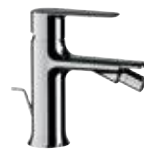
V 20 Miscelatore monocomando bidet. Single-lever bidet mixer.