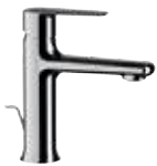
V 10 Miscelatore monocomando lavabo. Single-lever basin mixer.